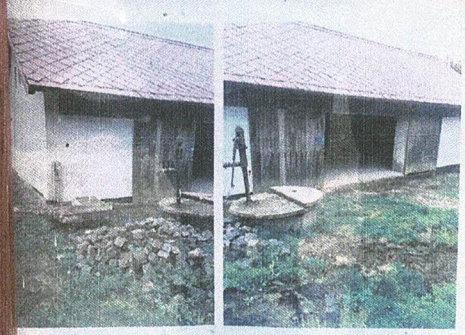
Projekt „Stavební úpravy skladu materiálu a nářadí“ podpořil KRAJ VYSOČINA z programu OBNOVA VENKOVA VYSOČINY 2026